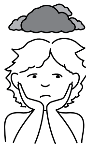
7. Somber zijn