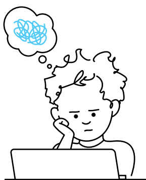
2. Moeite met concentreren