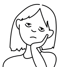
1. Moe zijn

Heeft u 3 maanden na corona nog steeds klachten? Dan noemen we dat Post-COVID of Long (lange) COVID. De meeste mensen met Long COVID hebben meer klachten tegelijk. De klachten hieronder genoemd komen het meest voor: