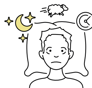
8. Moeite met slapen