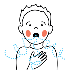
4. Benauwd zijn