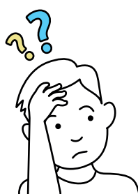
3. Dingen vergeten